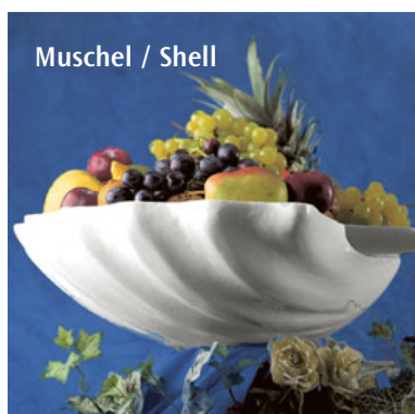
Muschel / Shell