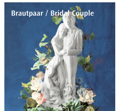
Brautpaar / Bridal Couple