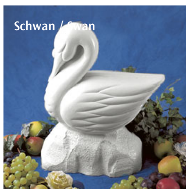
Schwan / Swan