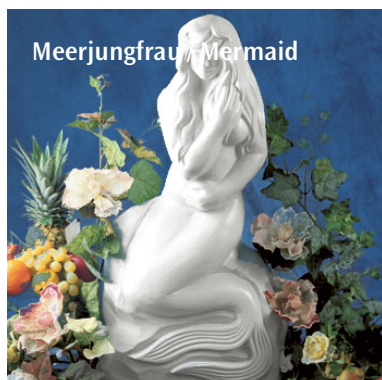
Meerjungfrau / Mermaid