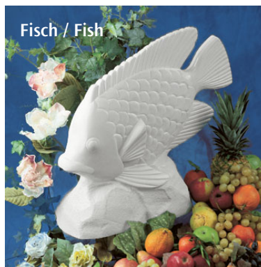
Fisch / Fish