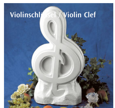
Violinschlüssel / Violin Clef