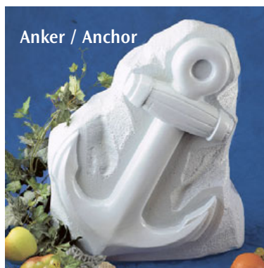
Anker / Anchor